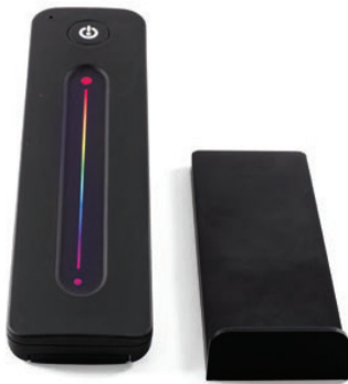
RGB / RGBW